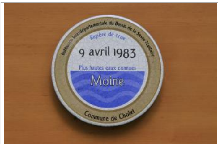
Vue du repère - Auteur : EPTB Sèvre Nantaise

Altitude calculée de l'eau (en m) : 76.16