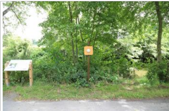
Vue du site - Auteur : EPTB Sèvre Nantaise

Coordonnées WGS84 : X: -0.86278600 / Y: 47.03999900