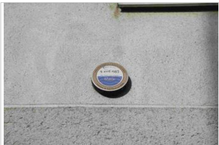
Vue du repère - Auteur : EPTB Sèvre Nantaise

Code : EPTBSN_R_MA-07 Date de mise à jour : Auteur : EPTB Sèvre Nantaise 10/02/2022