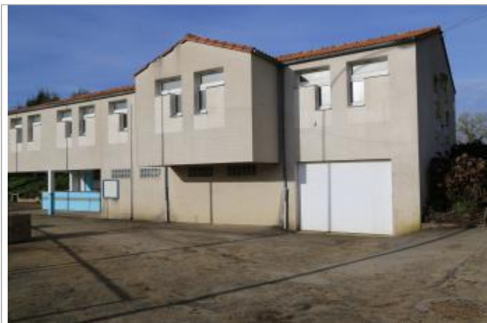
Vue du site - Auteur : EPTB Sèvre Nantaise