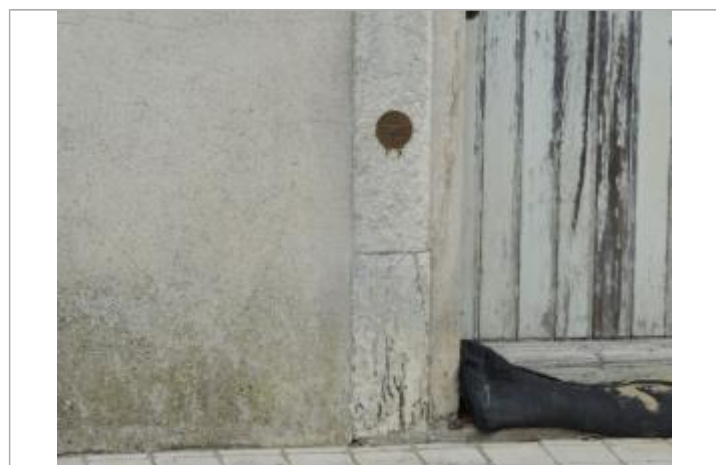
Vue détaillée - Auteur : EPTB_Charente