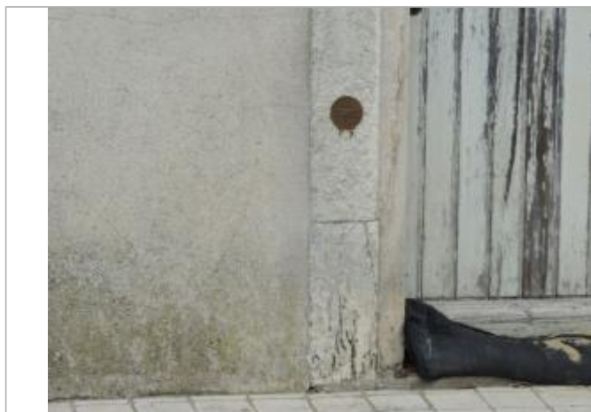
Vue détaillée

Altitude calculée de l'eau (en m) : 4.24 m