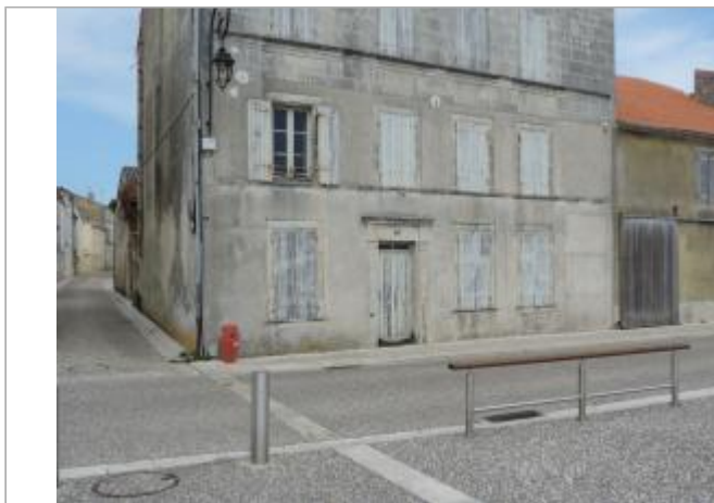
Vue de situation - Auteur : EPTB_Charente