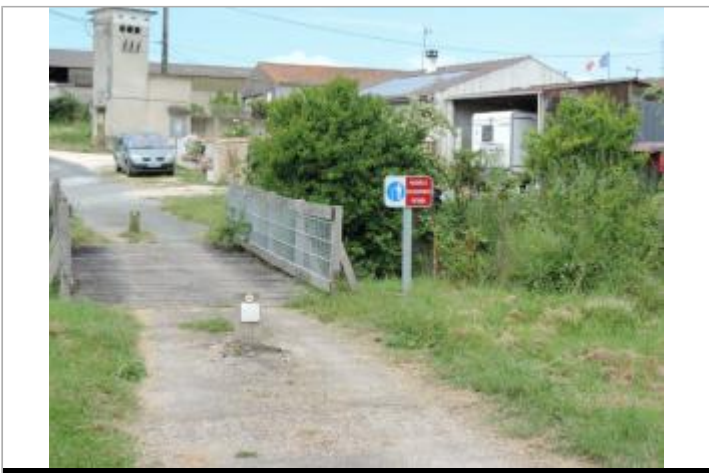
Vue de situation - Auteur : EPTB_Charente

GÉOLOCALISATION Coordonnées WGS84 : X: -0.98262150 / Y: 45.91282370 Coordonnées RGF93 (Lambert 93) : X: 391415.77 / Y: 6542576.56 Coordonnées RGF93 (ETRS89) : X: -0.9826215 / Y: 45.9128237 Code Hydro: _OATLANT Rive de référence: Non renseigné