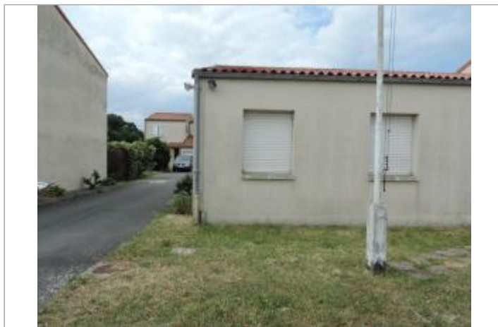
Vue de situation - Auteur : CARO_Rochefort