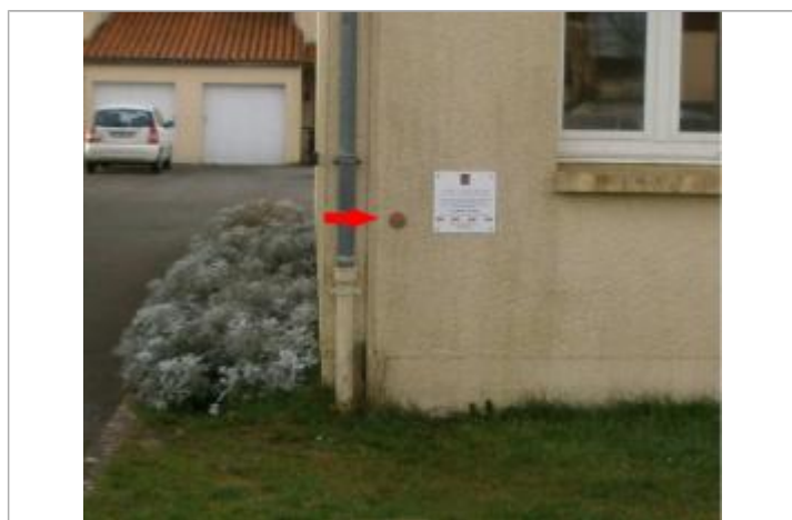
Vue détaillée

Maximum de l'inondation : Oui Visibilité : Oui État du repère : Bon Pérennité : Non renseigné Repère calculé : Non PHEC : Oui