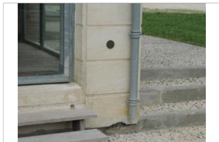
Vue détaillée