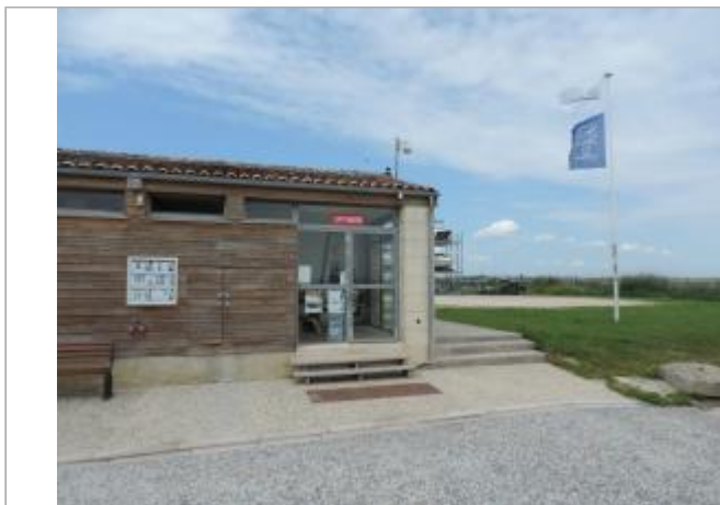
Vue de situation - Auteur : EPTB_Charente