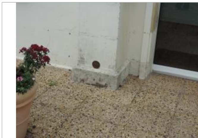
Vue détaillée - Auteur : EPTB_Charente

Altitude calculée de l'eau (en m) : 4.12 m