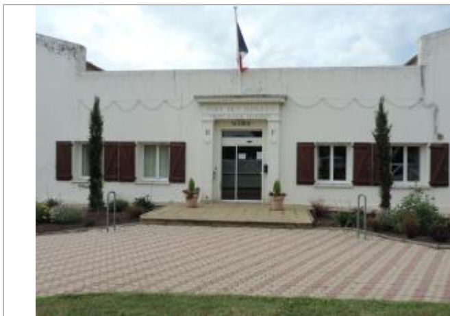
Vue de situation - Auteur : EPTB_Charente