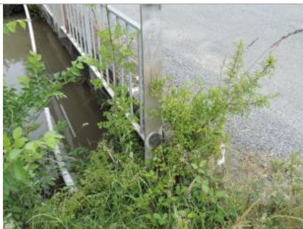
Vue détaillée - Auteur : EPTB_Charente

Altitude calculée de l'eau (en m) : 3.59 m