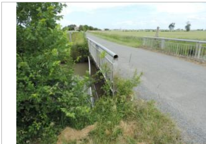
Vue de situation - Auteur : EPTB_Charente

Coordonnées WGS84 : X: -0.93536100 / Y: 45.92348770