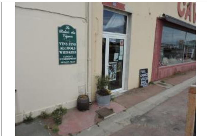
Vue de situation - Auteur : EPTB_Charente