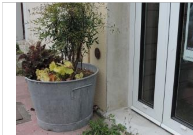
Vue détaillée - Auteur : EPTB_Charente

Altitude calculée de l'eau (en m) : 3.86 m