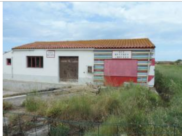
Vue de situation - Auteur : EPTB_Charente