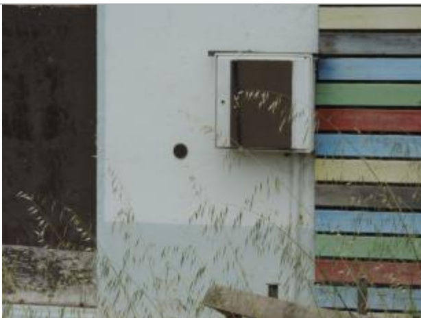
Vue détaillée - Auteur : EPTB_Charente

Altitude calculée de l'eau (en m) : 3.93 m