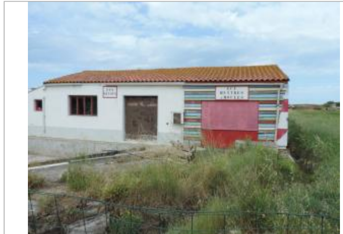
Vue de situation - Auteur : EPTB_Charente

Coordonnées WGS84 : X: -1.09642200 / Y: 45.94602450