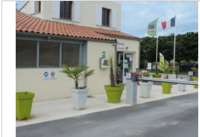
Vue de situation - Auteur : CARO_Rochefort

Coordonnées WGS84 : X: -1.09567330 / Y: 45.94808520