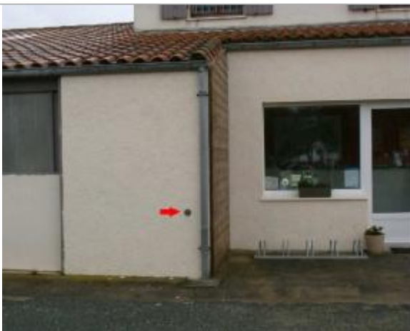
Vue détaillée

Altitude calculée de l'eau (en m) : 4.39 m