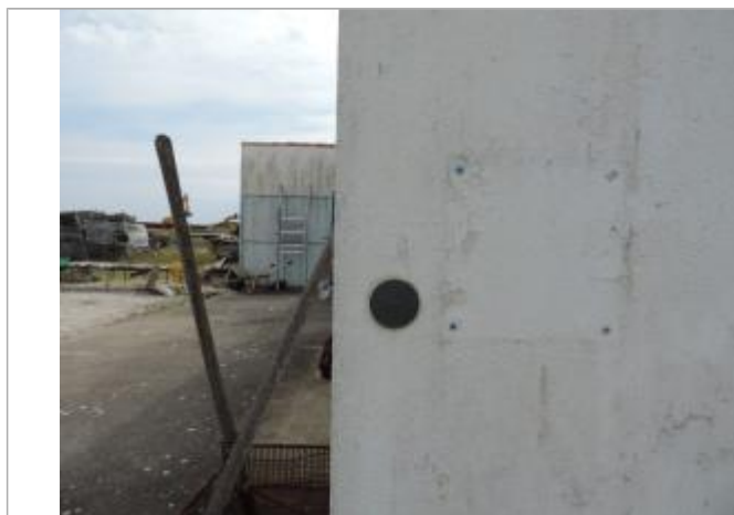
Vue détaillée - Auteur : EPTB_Charente