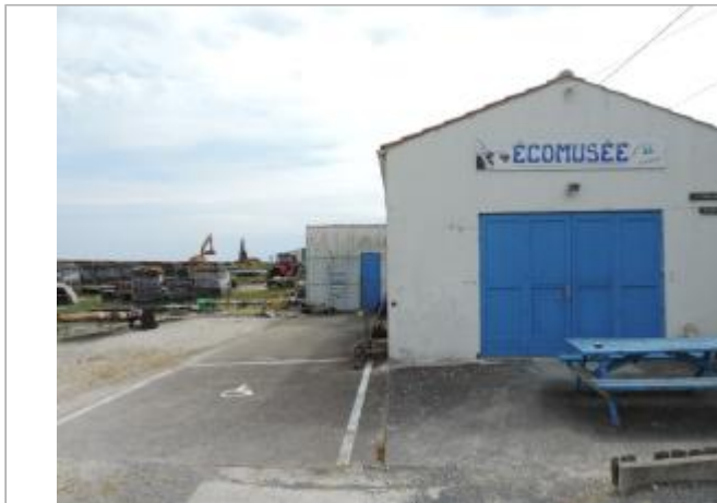
Vue de situation - Auteur : EPTB_Charente

Coordonnées WGS84 : X: -1.07334660 / Y: 45.94893910