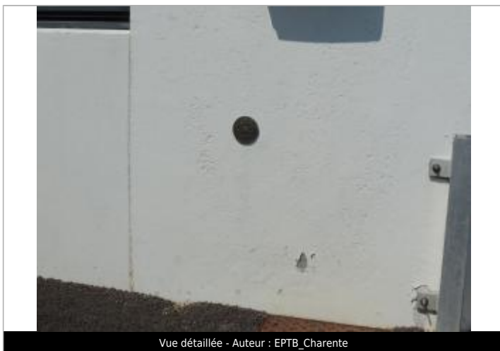
Vue détaillée

Altitude calculée de l'eau (en m) : 4.31 m