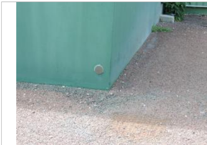
Vue détaillée

Altitude calculée de l'eau (en m) : 4.11 m