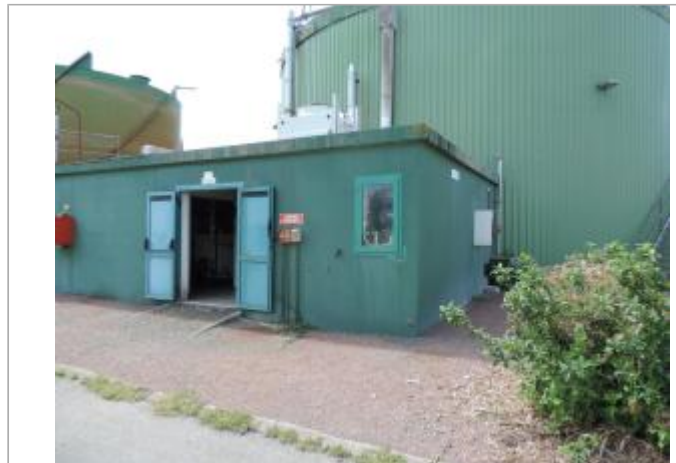
Vue de situation - Auteur : EPTB_Charente

Coordonnées WGS84 : X: -0.98039200 / Y: 45.91937610