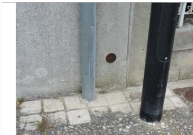
Vue détaillée