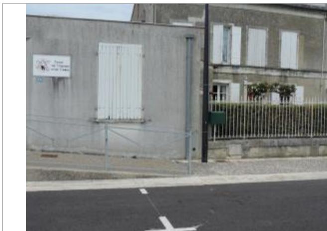
Vue de situation - Auteur : EPTB_Charente