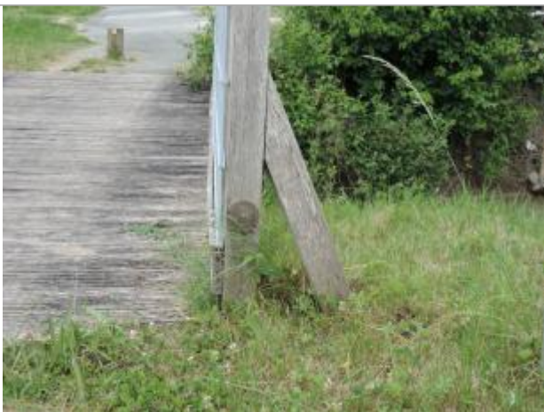
Vue détaillée - Auteur : EPTB_Charente

Altitude calculée de l'eau (en m) : 4.11