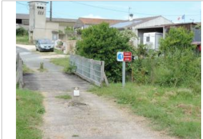
Vue de situation - Auteur : EPTB_Charente

Coordonnées WGS84 : X: -0.98262150 / Y: 45.91282370