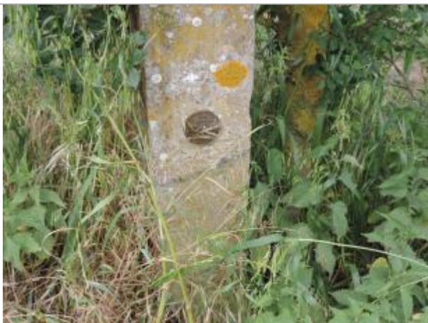
Vue détaillée - Auteur : EPTB_Charente

Altitude calculée de l'eau (en m) : 4.11