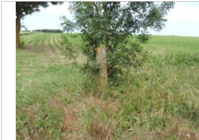
Vue de situation - Auteur : EPTB_Charente

Coordonnées WGS84 : X: -1.01032460 / Y: 45.95111140