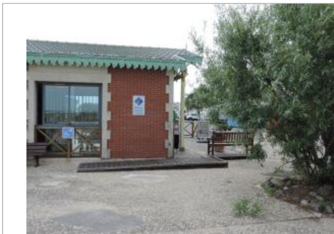
Vue de situation - Auteur : EPTB_Charente

Coordonnées WGS84 : X: -1.07820460 / Y: 45.94924620