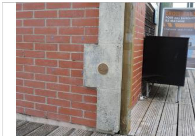
Vue détaillée - Auteur : EPTB_Charente

Altitude calculée de l'eau (en m) : 4.81