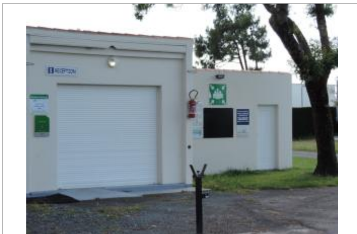
Vue de situation - Auteur : EPTB_Charente