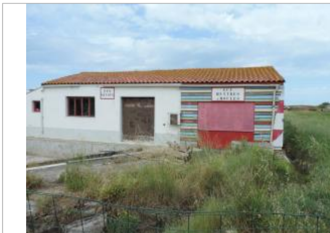
Vue de situation - Auteur : EPTB_Charente

Coordonnées WGS84 : X: -1.09642200 / Y: 45.94602450