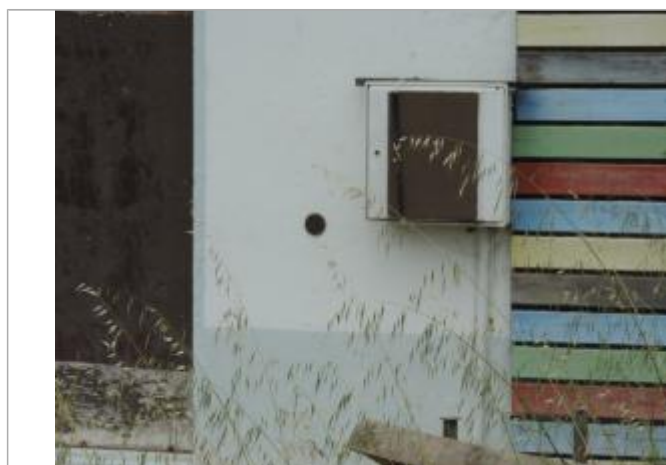
Vue détaillée - Auteur : EPTB_Charente