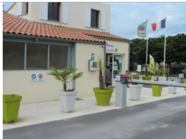
Vue de situation - Auteur : CARO_Rochefort