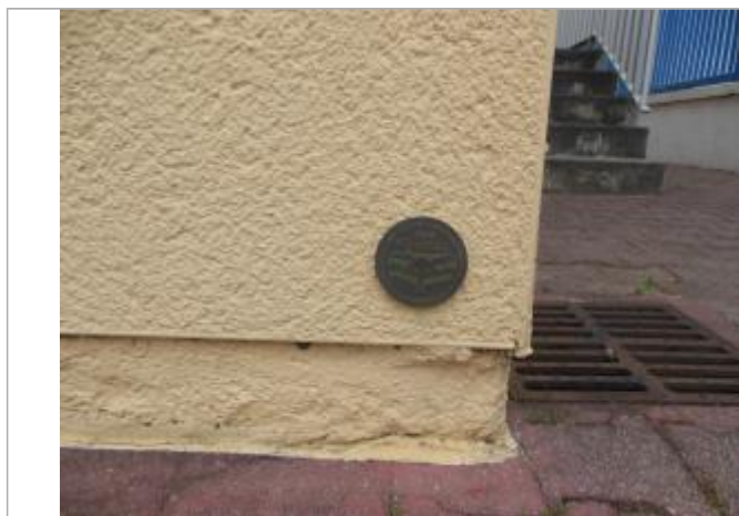
Vue détaillée