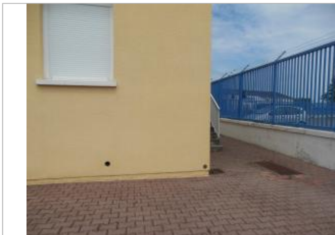
Vue de situation - Auteur : EPTB_Charente

Coordonnées WGS84 : X: -0.98545920 / Y: 45.93670310