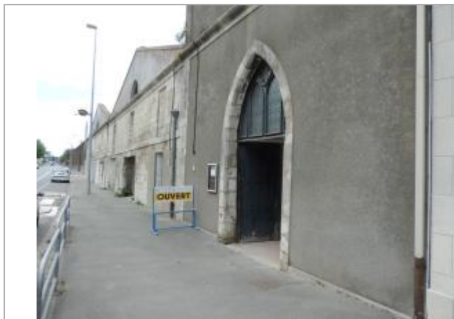
Vue de situation - Auteur : EPTB_Charente

Coordonnées WGS84 : X: -0.95090480 / Y: 45.94844390