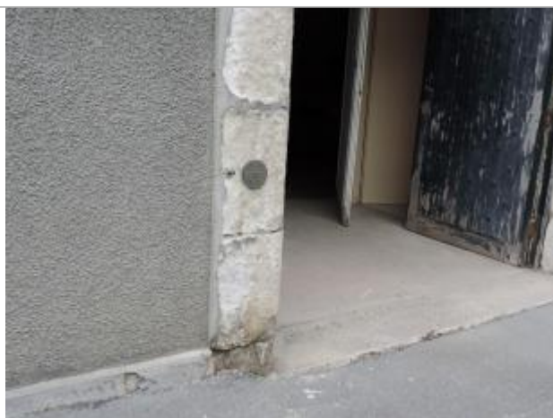
Vue détaillée

Altitude calculée de l'eau (en m) : 4.03