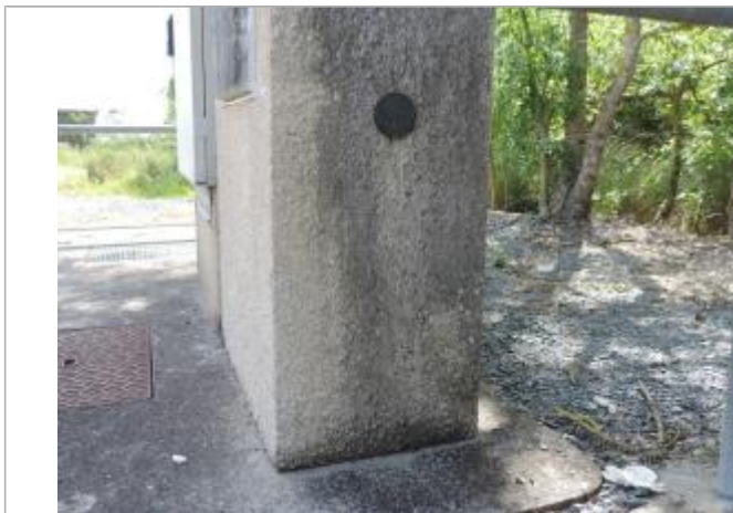
Vue détaillée - Auteur : EPTB_Charente

Altitude calculée de l'eau (en m) : 3.85