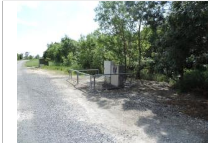
Vue de situation - Auteur : EPTB_Charente

Coordonnées WGS84 : X: -1.02864740 / Y: 45.98472100