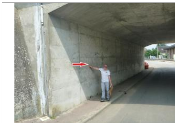
Vue de la laisse - Auteur : Cerema NC Labo de Blois

Code : CER_LO_16_R_181_1 Date de mise à jour : 31/07/2018 Auteur : A. Bontemps - Cerema Normandie-Centre