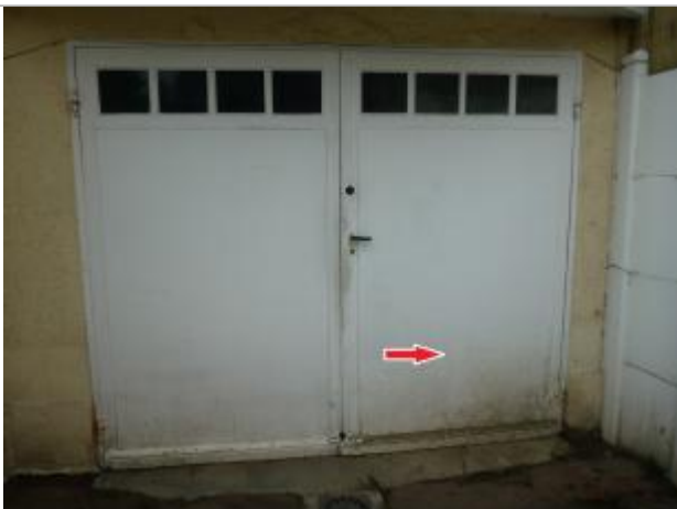
Vue de la laisse - Auteur : Cerema NC Labo de Blois

Altitude calculée de l'eau (en m) : 85.978 m