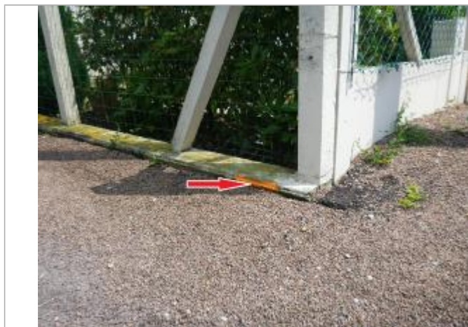
Vue de la laisse - Auteur : Cerema NC Labo de Blois

Maximum de l'inondation : Oui Visibilité : Non renseigné État du repère : Non renseigné Pérennité : Aucune Repère calculé : Non renseigné PHEC : Non renseigné