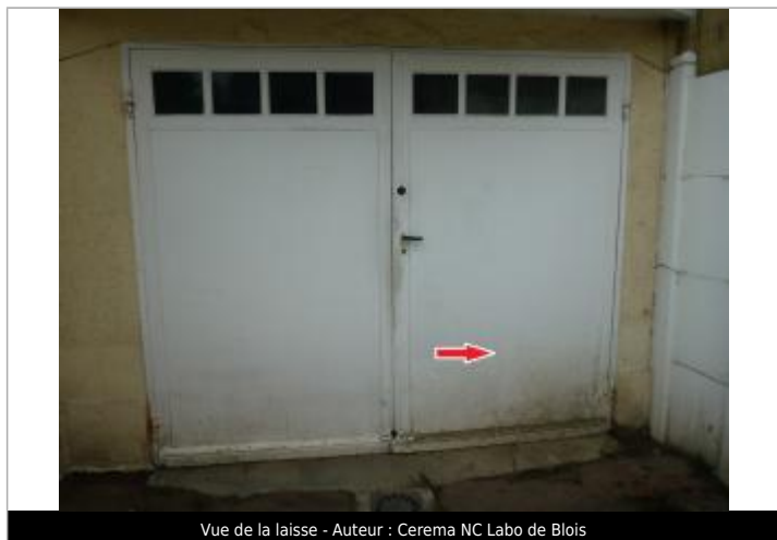
Vue de la laisse - Auteur : Cerema NC Labo de Blois

Maximum de l'inondation : Oui Visibilité : Non renseigné État du repère : Non renseigné Pérennité : Aucune Repère calculé : Non renseigné PHEC : Non renseigné