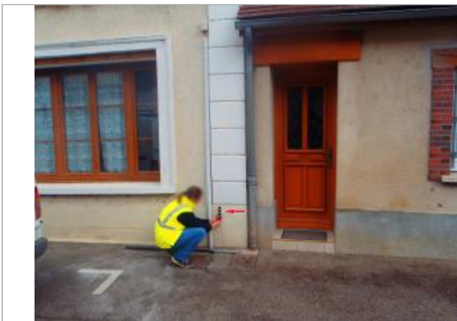
Vue du site - Auteur : Cerema NC Labo de Blois