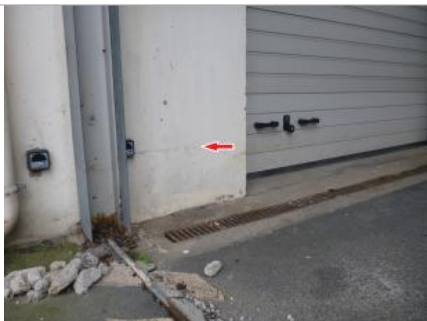
Vue de la laisse - Auteur : Cerema NC Labo de Blois

Altitude calculée de l'eau (en m) : 85.557