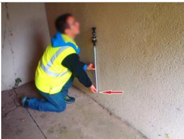
Vue de la laisse - Auteur : Cerema NC Labo de Blois

Altitude calculée de l'eau (en m) : 113.41