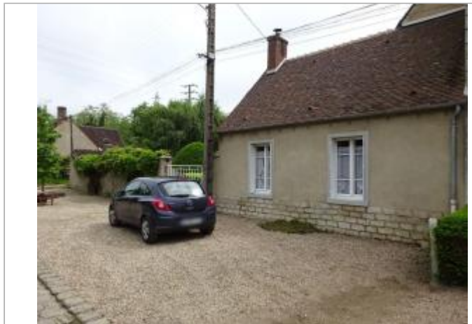
Vue du site - Auteur : SPC SMYL

Coordonnées WGS84 : X: 2.77316940 / Y: 48.10796300