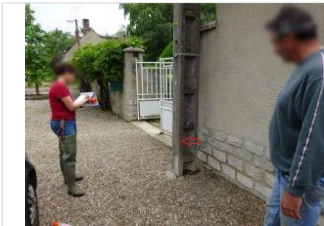
Vue de la laisse - Auteur : SPC SMYL

Altitude calculée de l'eau (en m) : 74.471 m