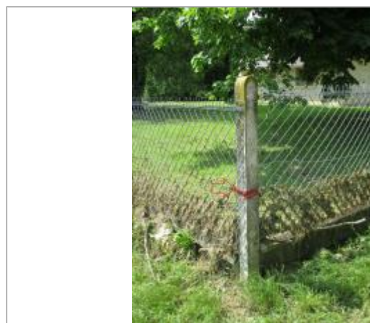
Vue de la laisse - Auteur : SPC SMYL

GÉNÉRAL Code : SMYL16_01_R_202_1 Date de mise à jour : 17/04/2018 Auteur : SPC SMYL