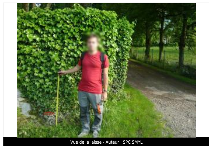
Vue de la laisse - Auteur : SPC SMYL

Code : SMYL16_01_R_188_1 Date de mise à jour : 12/08/2021 Auteur : SPC SMYL