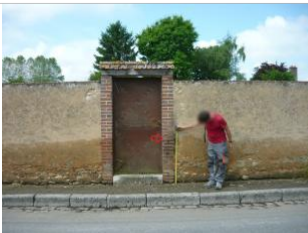
Vue de la laisse - Auteur : SPC SMYL