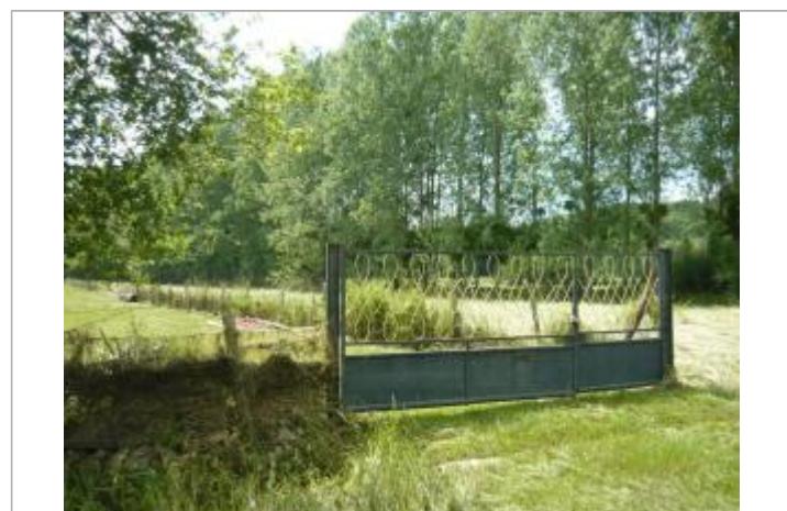
Vue de la laisse - Auteur : SPC SMYL