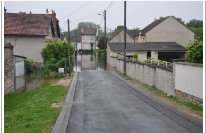
Vue du site - Auteur : SPC SMYL