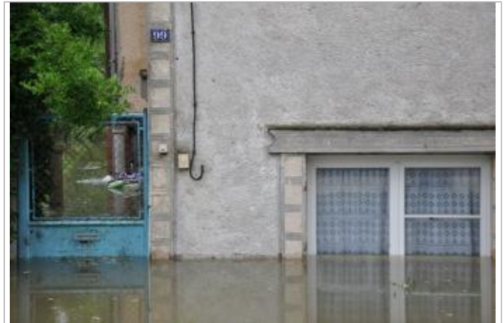
Vue du site - Auteur : SPC SMYL