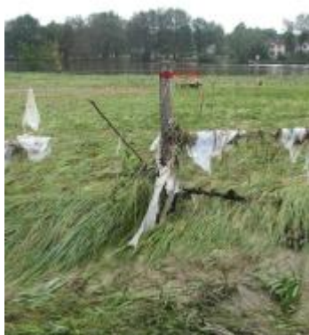
Vue de la laisse - Auteur : SPC SMYL

Altitude calculée de l'eau (en m) : 59.631