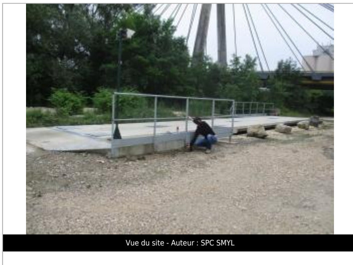
Vue du site - Auteur : SPC SMYL