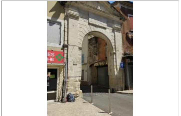
porte du centre ville