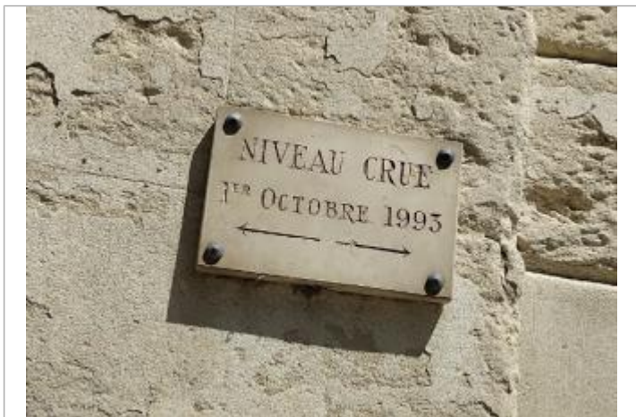
Repere - porte du centre ville

Texte : Niveau crue 1er octobre 1993 Maximum de l'inondation : Oui Visibilité : Oui État du repère : Bon Pérennité : Longue