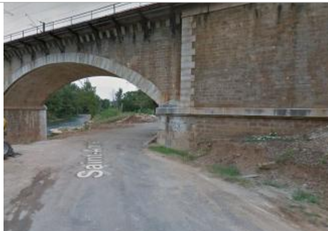
Vue du site supposé

Coordonnées WGS84 : X: 6.43266381 / Y: 43.43790020