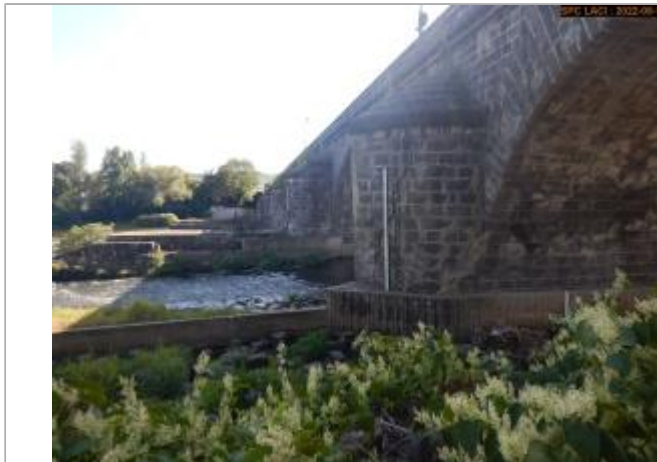
Vue du site éloignée