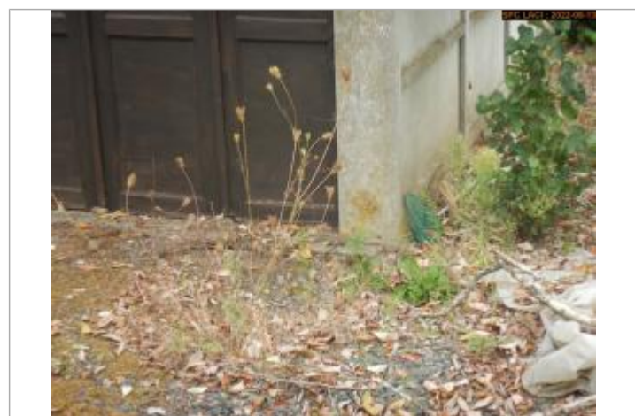
Vue du repère au pied du garrage (11/2008)

GÉNÉRAL Code : SPC_AL_R_0091_459 Date de mise à jour : 19/12/2022 Auteur : SPC Allier