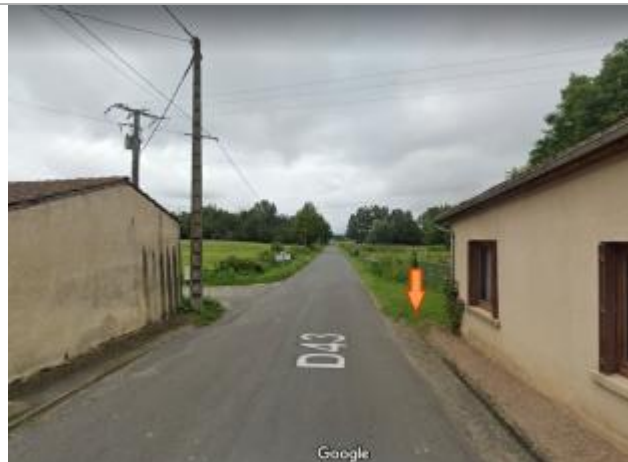
Vue du site éloignée (GoogleMap)