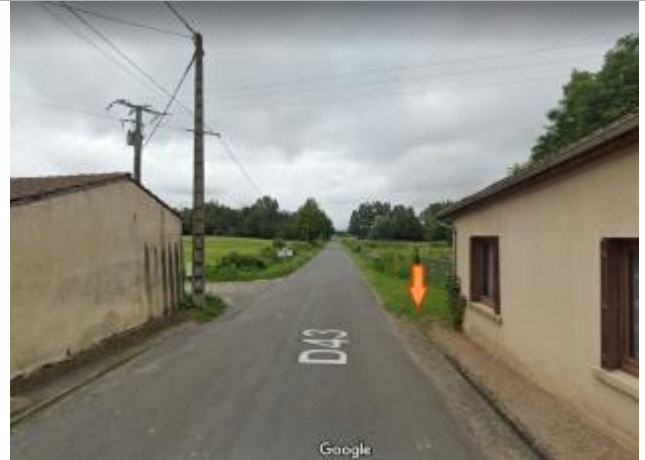
Vue du site éloignée (GoogleMap)

Coordonnées WGS84 : X: 3.46125110 / Y: 45.99888850