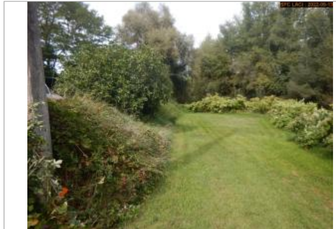
Vue du site (vers l'Allier)

Coordonnées WGS84 : X: 3.46163566 / Y: 45.99890227