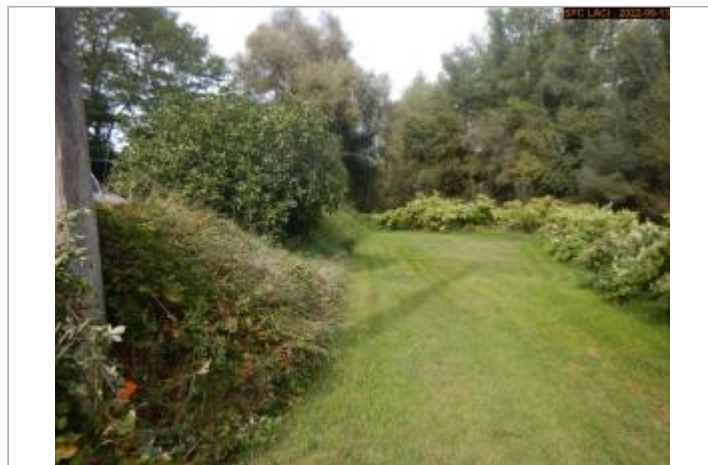
Vue du site (vers l'Allier)

GÉOLOCALISATION Coordonnées WGS84 : X: 3.46163566 / Y: 45.99890227 Coordonnées RGF93 (Lambert 93) X: 735727.85 / Y: 6544456.39 Coordonnées RGF93 (ETRS89) : X: 3.4616357 / Y: 45.9989023 Code Hydro: K---0080 Rive de référence: Droite