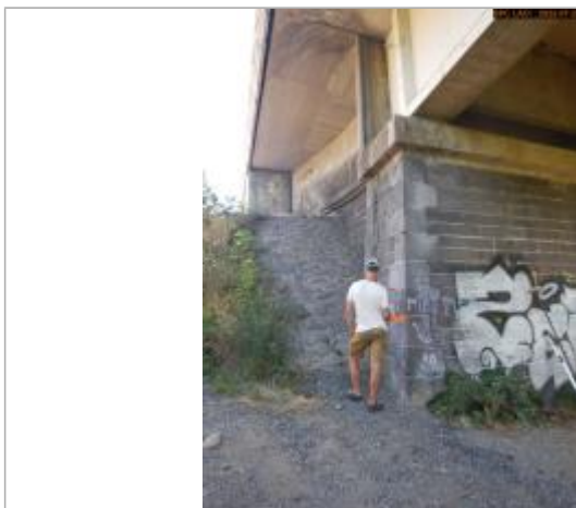
Vue du repère éloignée

Altitude calculée de l'eau (en m) : 330.54 m