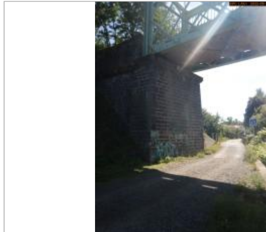
Vue du site éloignée (côté aval)