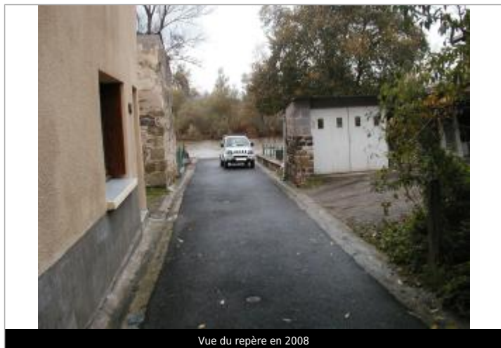
Vue du repère en 2008

Altitude calculée de l'eau (en m) : 315.7 m